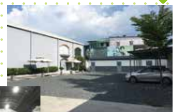
広大な敷地の中に広い駐車場と(奥に作品のパネルが並んでいます)、オフィスがあります。