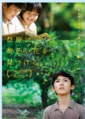
「草原に黄色い花を見つける」