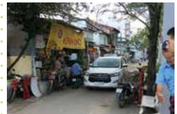
ホーチミンの7区の路地に入っただけでなく...