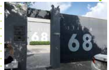
立派な建物が現れます。