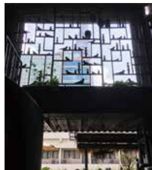
住所:4-6 Đồng Khởi, Bến Nghé, Quận 1, Hồ Chí Minh,